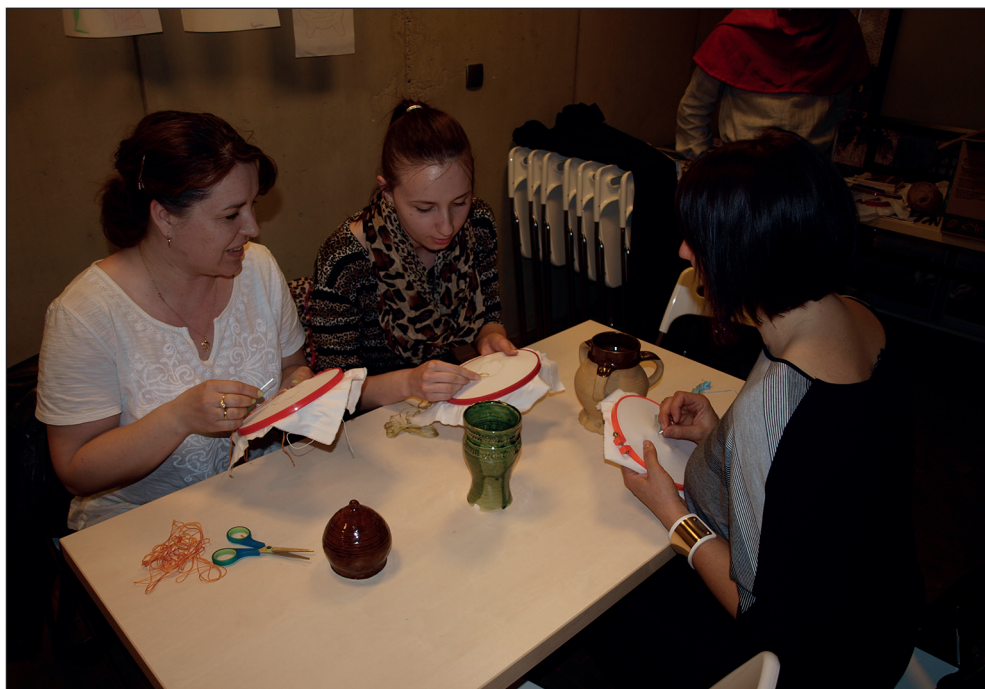
Ryc. 12. „Noc Muzeów” 2014.