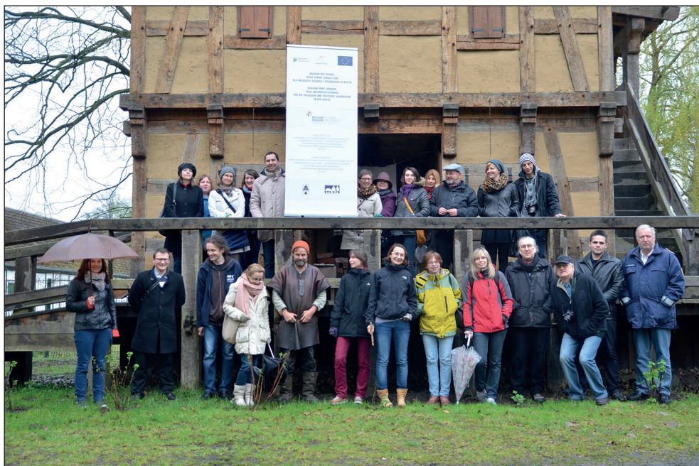
Ryc. 6. Wyjazd studyjny w ramach projektu Muzeum bez granic , Castrum Turgłowe.