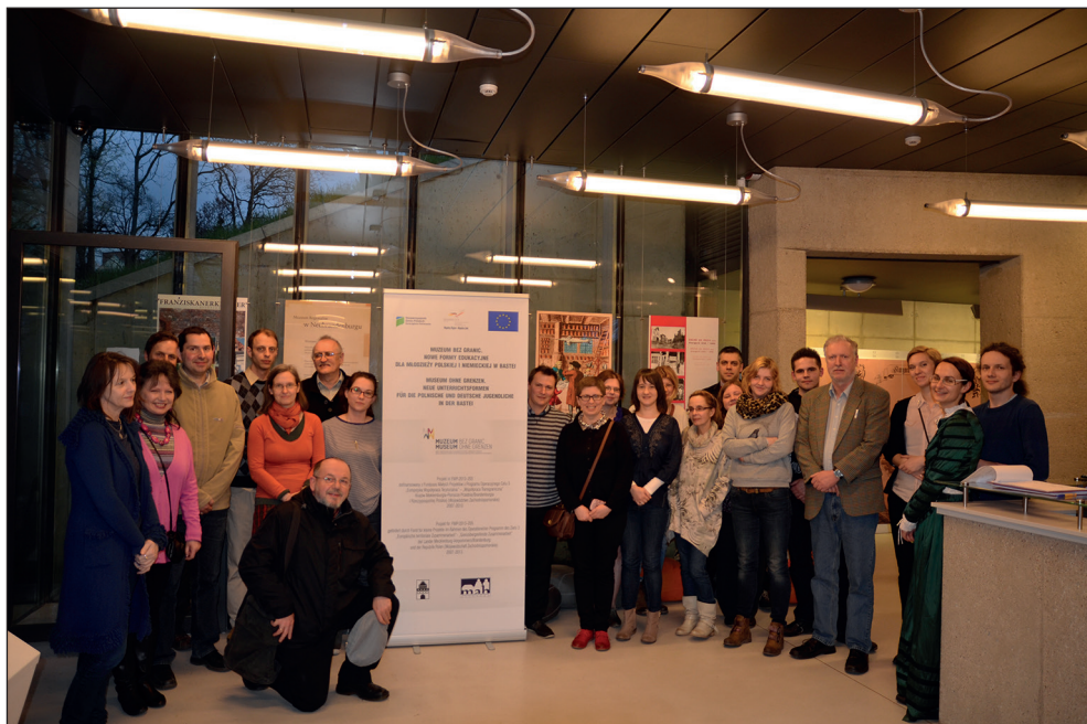
Ryc. 4. Wyjazd studyjny w ramach projektu Muzeum bez granic. Fot. P. Antczak, MAH w Stargardzie