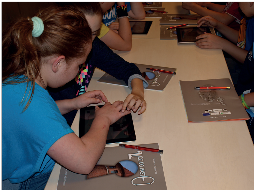
Ryc. 7. Lekcja Klucz do Bastei w ramach projektu Muzeum bez granic .