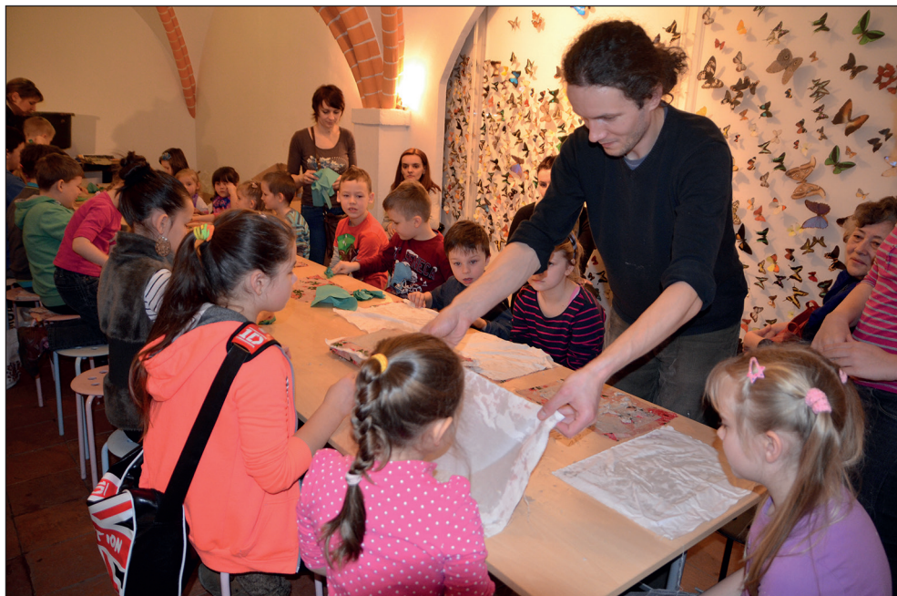
Ryc. 3. Zajęcia w ramach „Ferii w Muzeum”.