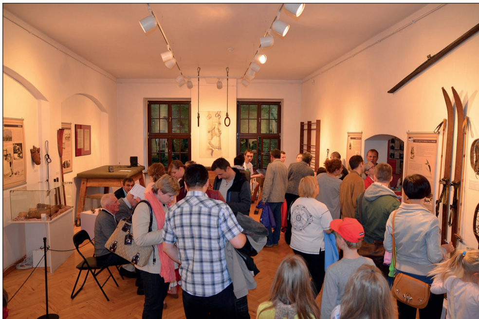
Ryc. 11. „Noc Muzeów” 2014.