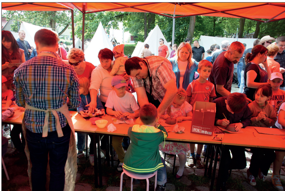
Ryc. 14. Zajęcia edukacyjne podczas „Festynu Historycznego”.