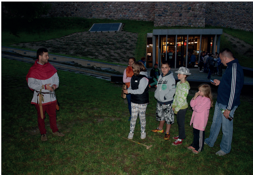
Ryc. 13. „Noc Muzeów” 2014.