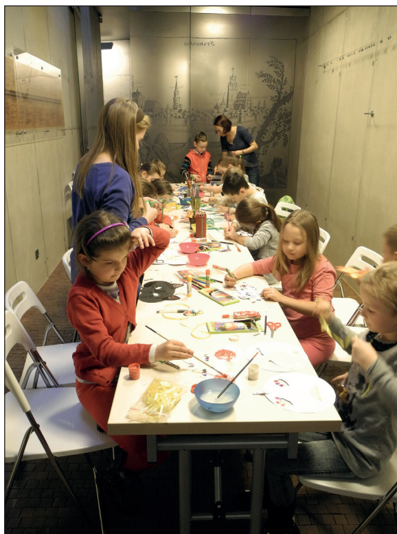
Ryc. 2. Zajęcia w ramach „Ferii w Muzeum”.