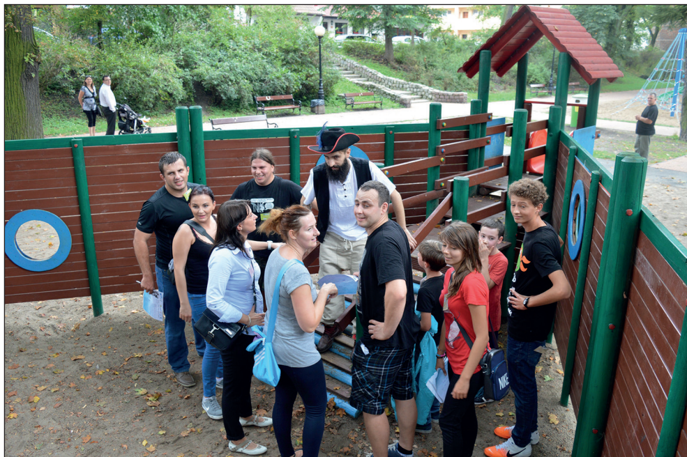
Ryc. 15. Gra miejska „Na tropie Kapitana Kleista”.