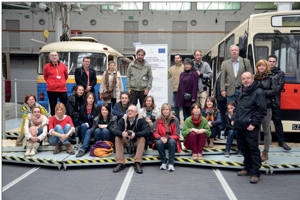
Ryc. 5. Wyjazd studyjny w ramach projektu Muzeum bez granic , Muzeum Techniki i Komunikacji w Szczecinie.