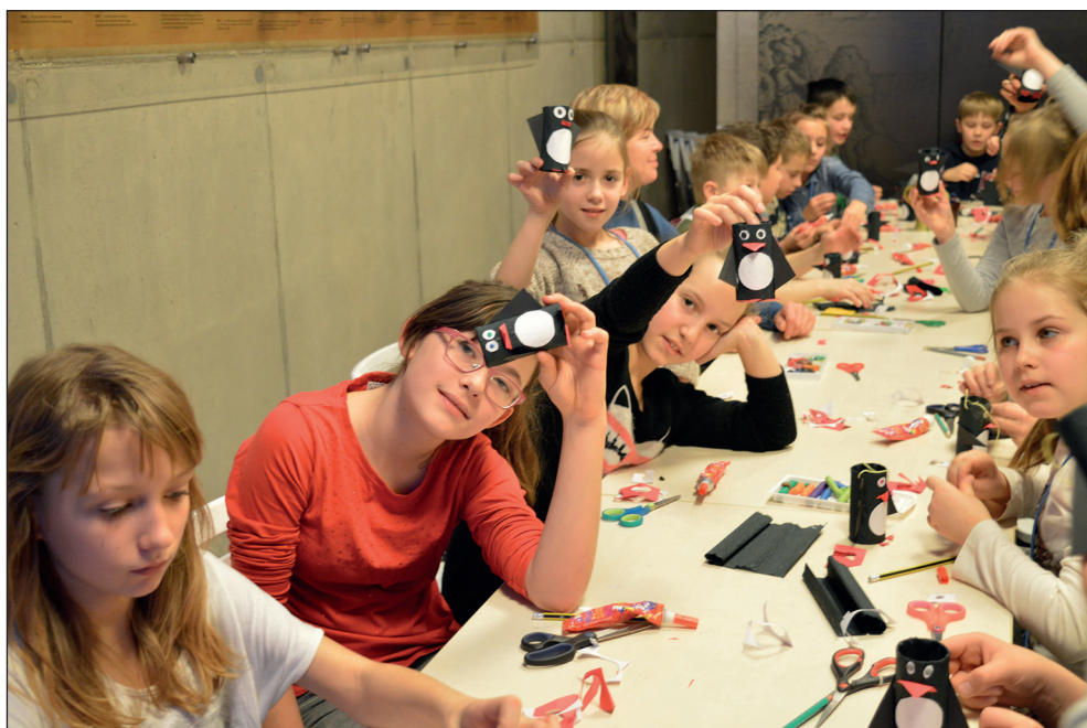
Ryc. 16. Zajęcia bożonarodzeniowe w Bastei.