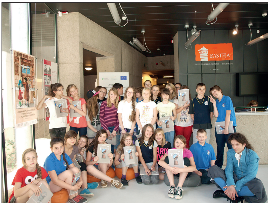
Ryc. 10. Dzień integracyjny młodzieży polskiej i niemieckiej w ramach projektu Muzeum bez granic .