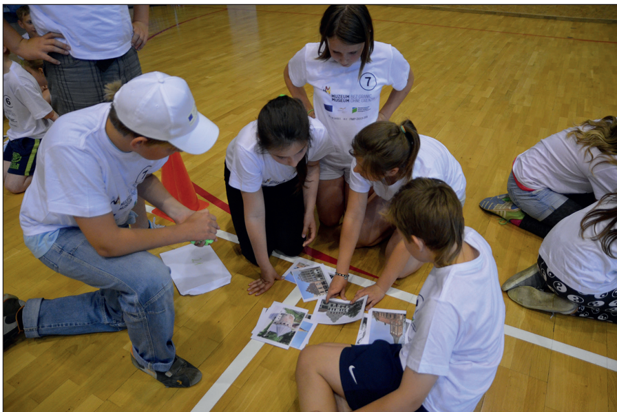
Ryc. 9. Grupa biorąca udział w lekcji Klucz do Bastei w ramach projektu Muzeum bez granic .