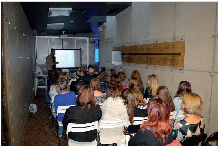
Ryc. 1. „Muzealne Spotkania z Przeszłością”.