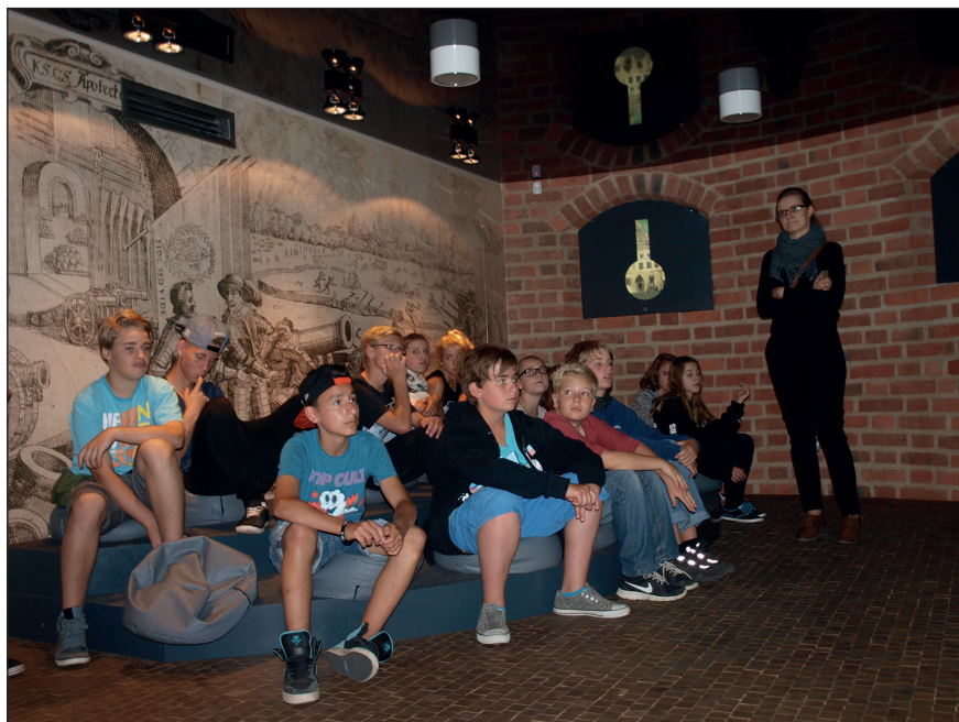
Ryc. 8. Grupa niemiecka biorąca udział w lekcji Klucz do Bastei w ramach projektu Muzeum bez granic .